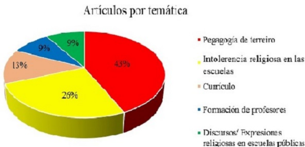
FIGURA 4. Artículos por tema

Con base en el análisis vertical de los artículos, es decir, al realizar el análisis comparativo, se organizaron los estudios por temas, enfatizando en que algunos de ellos podrían ubicarse en más de una categoría temática. En estos casos, se utilizó como criterio de clasificación el tema destacado por los autores en el objetivo de las investigaciones. La organización de los estudios por tema explica con mayor claridad qué temas han sido abordados con mayor frecuencia en la investigación. La mayoría de los estudios sobre la relación candomblé-escuela abordan el tema pedagogía de terreiro (43 %), seguido de los temas de intolerancia religiosa en las escuelas (26 %), currículo (13 %), formación de profesores y discursos/expresiones religiosas en las escuelas públicas (9 % cada uno) (Figura 4).