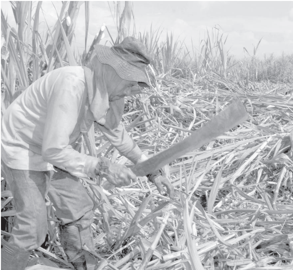
El Valle del Cauca tratará de sacarle el mejor provecho a uno de sus principales productos.

tienen que ver con la infraestructura eléctrica y de telecomunicaciones; el desarrollo y montaje de centros de conocimiento y negocios, así como de parques tecnológicos e industriales” 31 .