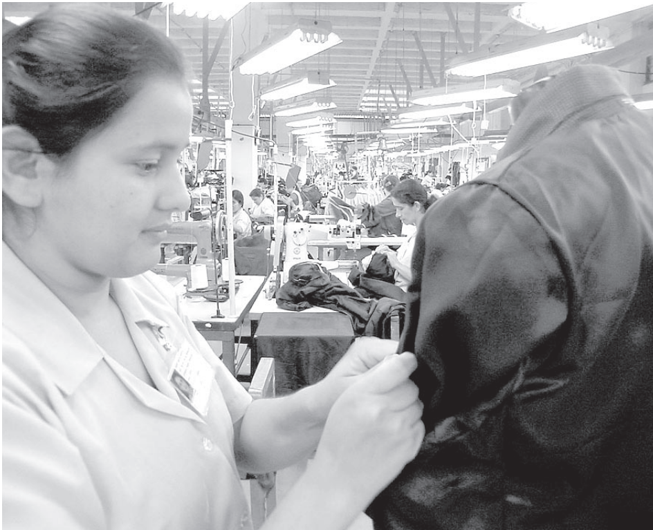
La mano de obra calificada se beneficiara con el TLC.

cos, azúcar, papel y cartón, molinería, productos alimenticios, bebidas, aceites, conservas de carne, productos lácteos, plástico, impresos, confecciones, productos de caucho, química básica, minerales no metálicos, productos de café, textiles, cueros, tejidos de punto, aserrado de la madera y acabados textiles, se le apuesta productivamente a los químicos, el azúcar, el papel y cartón, los aceites, las conservas de carne, los impresos, las confecciones, los productos de café, los textiles, los cueros, los tejidos de punto, el aserrado de la madera y los acabados textiles.