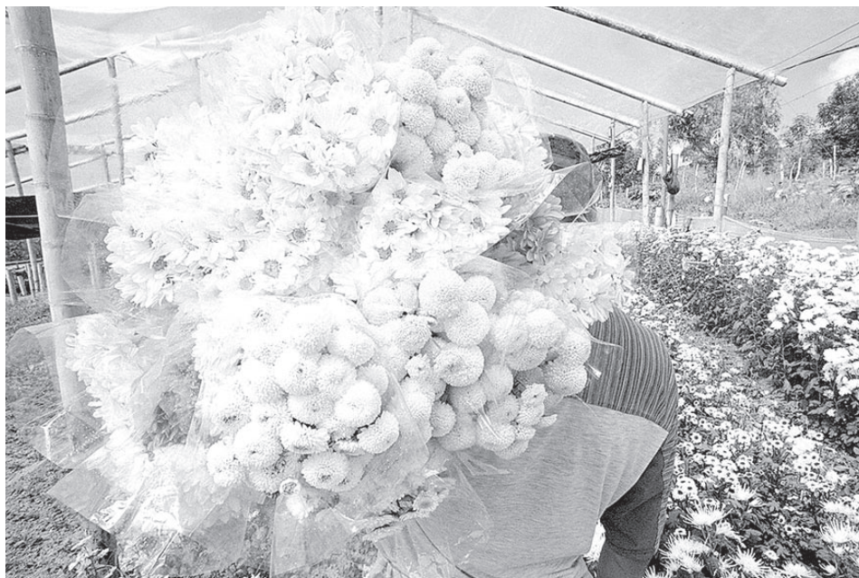
Las flores colombianas es uno de los productos con mayor demanda internacional.

La participación de las exportaciones no tradicionales hacia Estados Unidos ha sido muy importante en los últimos años, alrededor de un 37% del total. Los sectores de mayor crecimiento han sido el de química básica, el de alimentos y bebidas, tabaco, textiles, confecciones y cuero.